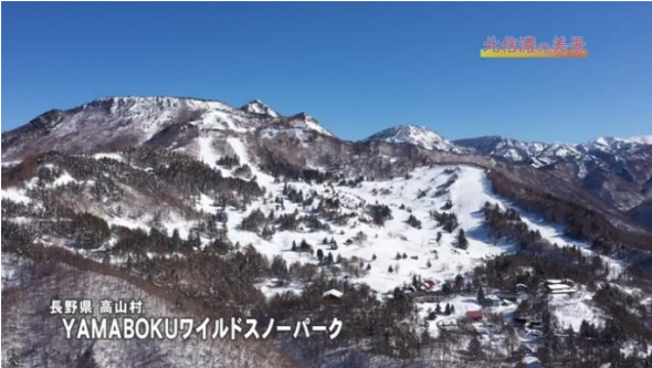
※南日本放送と Goolight の空撮映像イメージ